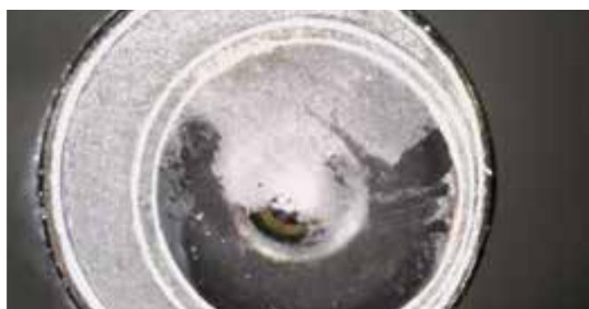
Détail d'une lentille avant le traitement BICAR med ®