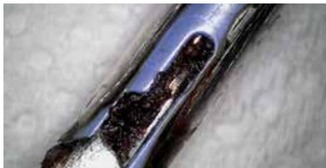
Détail d'une pince laparoscopique avant le traitement BICAR med ®