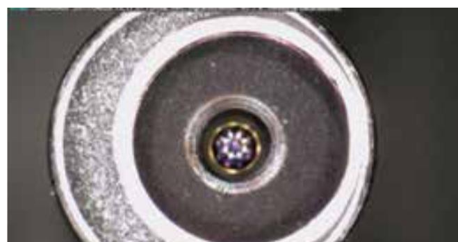
Détail de la même lentille après le traitement BICAR med ®