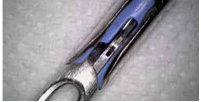
Detail van hetzelfde pincet na de BICARmed®-behandeling