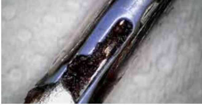
Detail van een laparoscopische pincet vóór de BICARmed®-behandeling