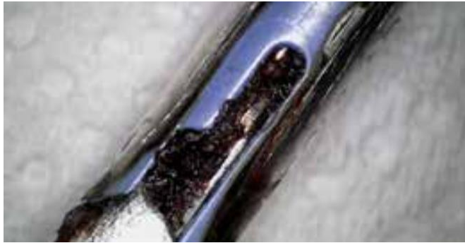
Detailansicht einer laparoskopischen Pinzette vor der BICARmed®-Behandlung